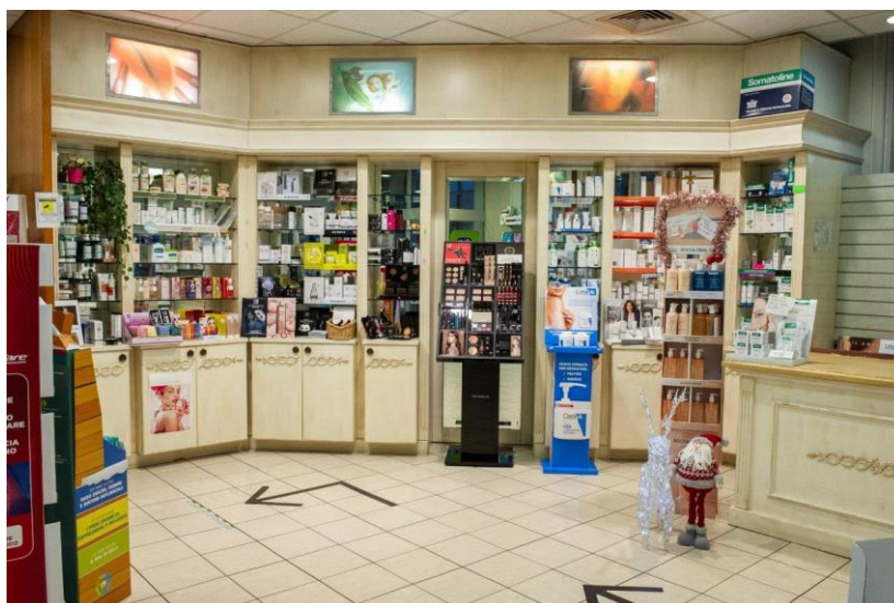
Farmacia Comunale Prima – Reparto cosmesi

Nel prioritario rispetto dei bisogni degli utenti e in attuazione del principio di continuità, anche riguardo a modalità di servizio che effettivamente tutelino il diritto del cittadino alla salute, la Società si obbliga a non aderire ad azioni di protesta che comportino per gli utenti l'assistenza indiretta.