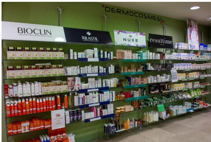
Farmacia Comunale Seconda – reparto cosmesi